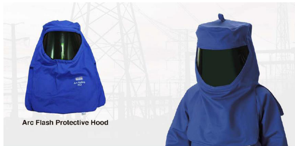
Arc Flash Protective Hood