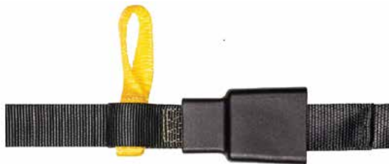
Accesorios opcionales: cintas para amarre y cubiertas de plástico en herrajes